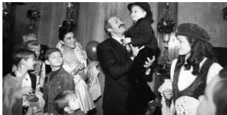
Декабрь, 1997 г. На новогоднюю елку собрались в Республиканском клубе дети из армейских семей.

100 ОСУЩЕСТВИТЬ ДЕТСКУЮ МЕЧТУ МОЖЕТ КАЖДЫЙ!